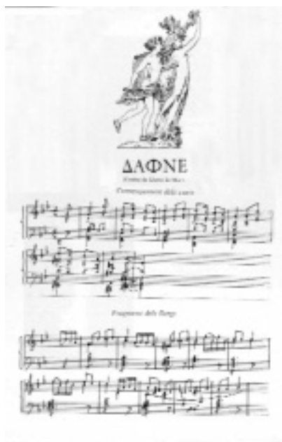
Partitura de la sardana El galanteig d'Apol·lo .